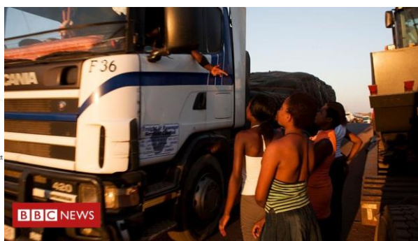
seks werkers bij de grensovergang van Nakonde